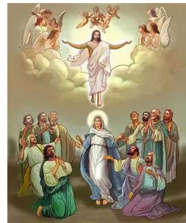
ASCENSION DU SEIGNEUR